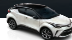
Blanco Perlado Bitono