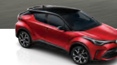
Rojo Emoción Bitono