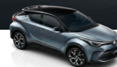
Gris Celestita Bitono