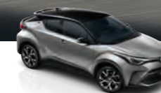
Gris Diamante Bitono