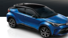
Azul Nébula Bitono