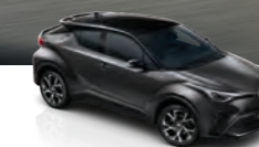
Gris Grafito Bitono